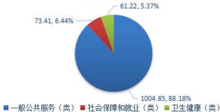
图6：2020年一般公共预算财政拨款支出情况 (单位：万元)