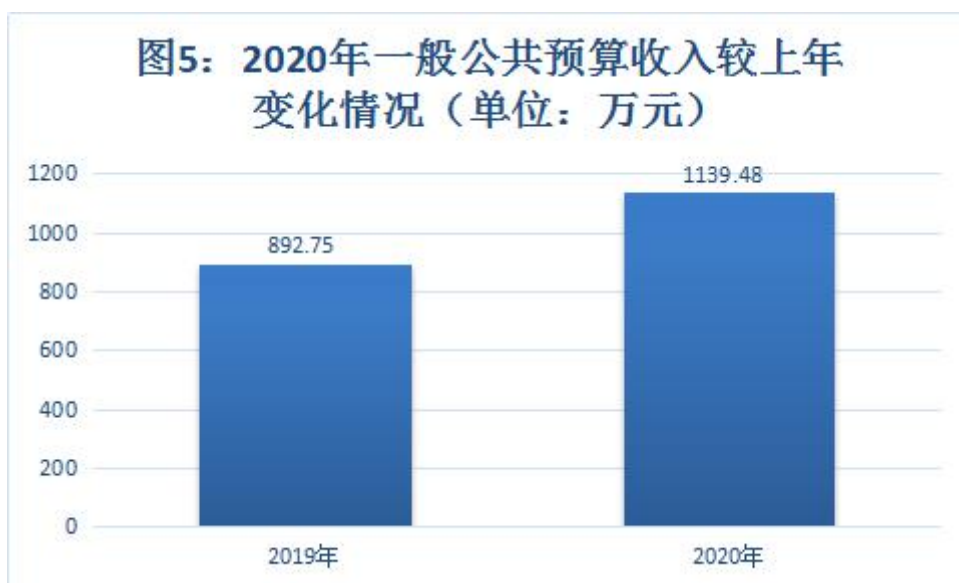
图5：2020年一般公共预算收入较上年 变化情况 (单位：万元)

2020年一般公共预算财政拨款支出预算为1139.48万元，比上年增长27.64%，其中：一般公共预算服务(类)支出1004.85万元，占比88.18%；社会保障和就业(类)支出73.41万元，占比6.44%；卫生健康(类)支出61.22万元，占比5.37%。